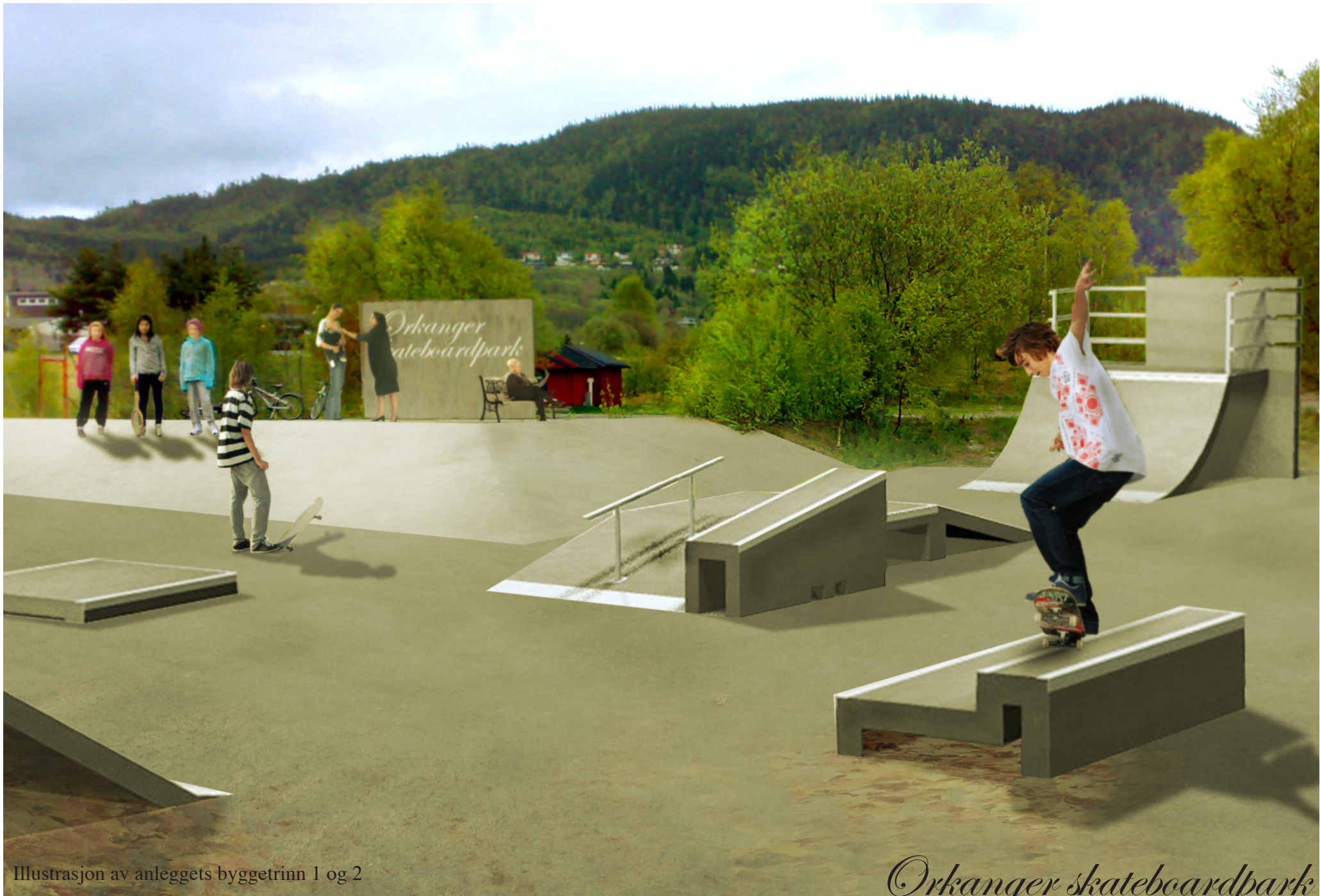
Illustrasjon av anleggets byggetrinn 1 og 2