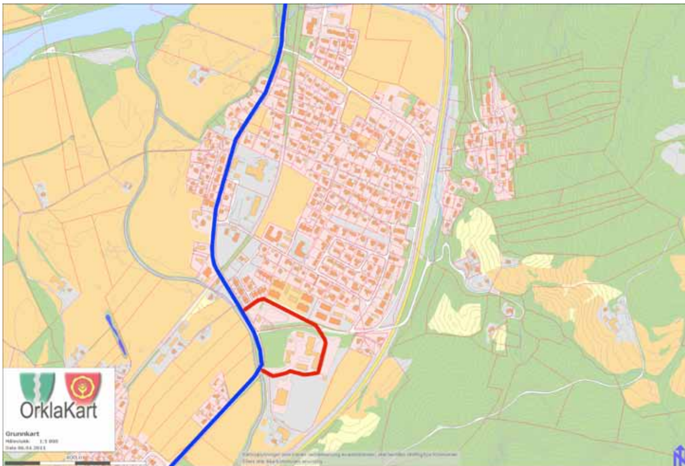
01 BUSSAVVIKLING FØR UTBYGGING